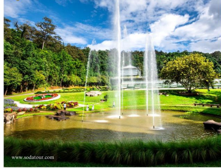
สวนพฤกษศาสตร์สมเด็จพระนางเจ้าสิริกิติ์