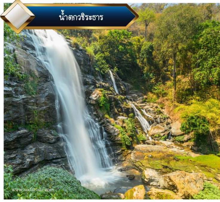
น้ำตกวชิระธาร

เที่ยวชม ตลาดม้ง ที่มีทั้งผัก, ผลไม้สดๆ และของฝากต่างๆจากชาวเขา ก่อนนำท่านชม น้ำตกวชิระธาร น้ำตกที่มีความสวยงาม และอยู่ไม่ไกล และให้ท่านได้ซื้อของฝากจากชาวเขา สมควรแก่เวลานำท่านเดินทางกลับสู่ตัวเมืองเชียงใหม่