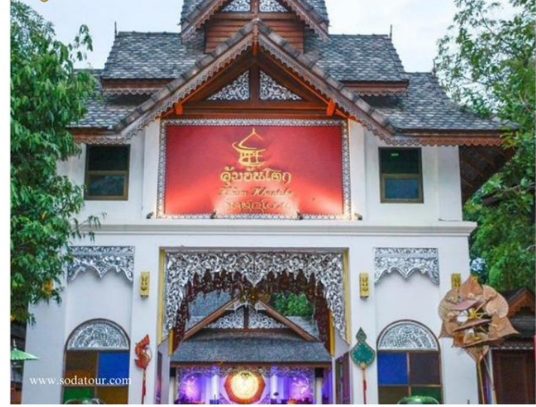
คุ้มขันโตก

นำคณะเดินทางไปรับประทานอาหารค่ำ 📍อาหารค่ำ อิสระตามอัธยาศัย ณ คุ้มขันโตก พร้อมชมการแสดงพื้นเมืองลานนา หลังอาหารนำคณะเดินทางกลับที่พัก อิสระพักผ่อนตามอัธยาศัย / หรือ (Driver Guide แนะนำร้านที่ดีที่สุดในย่านนี้ให้)