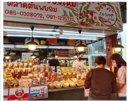
ตลาดต้นนวม