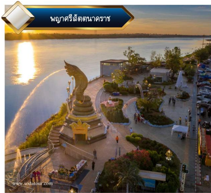
พญาครีส์ตขนาดราช

“เที่ยวครบรส จบที่เดียว ความแตกต่างอีกระดับ..ที่คุณสัมผัสได้”