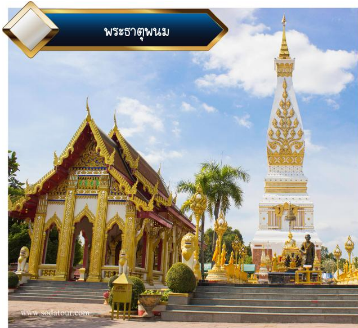
พระธาตุพนม

นำท่านสักการะ พระธาตุพนม พระธาตุประจำวันเกิดวันอาทิตย์ พระธาตุพนม ประดิษฐาน ณ วัดพระธาตุพนมมรุมหาวิหาร อ.ธาตุพนม มีลักษณะเป็นเจดีย์รูปสี่เหลี่ยมจัตุรัสก่อด้วยอิฐ ภายในบรรจุพระอัฐธาตุ (กระดูกส่วนหน้าอก) ของพระสัมมาสัมพุทธเจ้า พระธาตุพนมนั้นไม่เพียงแต่เป็น ศูนย์รวมจิตใจของชาวนครพนม และภาคอีสานเท่านั้น แต่ยังเป็นทีเคารพของ ชาวไทยภาคอื่น ๆ และชาวลาวอีกด้วย ว่ากันว่าถ้าใครได้มานมัสการองค์พระธาตุพนมครบ 7 ครั้ง จะถือว่าเป็น “ลูกพระธาตุ” เป็นสิริมงคลแก่ชีวิตและจะมีความเจริญรุ่งเรือง