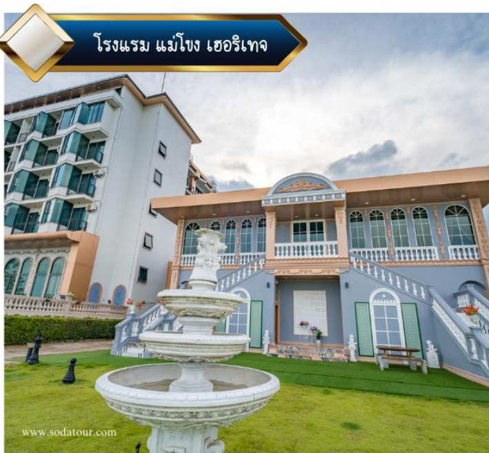
โรงแรม แม่โขง เฮอริเทจ

“เที่ยวครบรส จบที่เดียว ความแตกต่างอีกระดับ..ที่คุณสัมผัสได้”